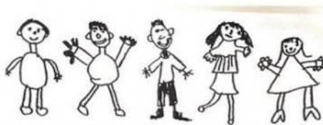
Dessins enfants TV moins de 60 minutes par jour © Peter Winterstein : Macht Fernseh dumm?

Voici les dessins d'enfants qui regardent la TV au maximum 60 minutes par jour: