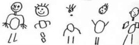
Dessins enfants seuls devant TV / traumatismes familiaux © Peter Winterstein : Macht Fernseh dumm?

Enfin voici les dessins d'enfants qu'on a laissés seuls regarder la TV et qui en ont subi des traumatismes importants